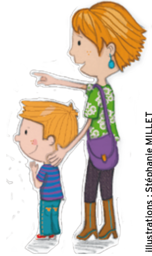
Illustrations : Stéphanie MILLET

Pour nous, mouvements de l'éducation populaire, l'éducation des enfants impliquent les parents, les animateurs, les éducateurs, les ATSEM et les enseignants. A ce titre, les parents ont toute leur place dans ce nouveau dispositif. Seuls, il est difficile pour eux de se faire entendre. C'est pourquoi nous les invitons à rejoindre les associations locales et évidemment celles de parents d'élèves pour envisager ensemble ce qu'il y a de mieux pour leurs enfants. La réforme qui est proposée doit permettre un tel investissement de toutes et tous.