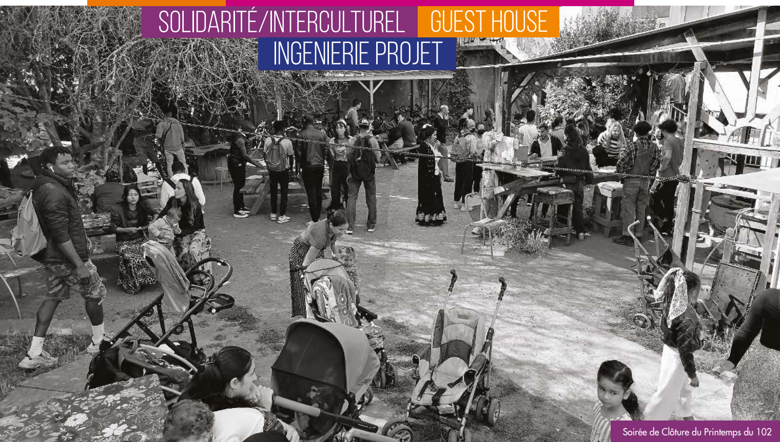
Soirée de Clôture du Printemps du 102